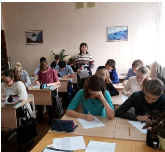
Фото с тренинга